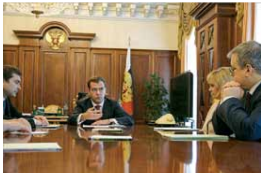
Президент РФ Д.А. Медведев обсуждает планы рабочей группы по развитию НКО с В.Ю. Сурковым, Э.А. Памфиловой и Я.И. Кузьминым

Создана весной 2009 г., в числе для подготовки заседаний межведомственной рабочей группы по совершенствованию законодательства РФ об НКО, в состав которой наряду с членами рабочей группы Совета по развитию НКО вошли представители Общественной палаты РФ, Федерального Собрания РФ, Администрации Президента РФ, Правительства РФ, профильных министерств и ведомств (в 2009–2011 гг. возглавлял В.Ю. Сурков). С просьбой создать такую РГ Совет обратился к