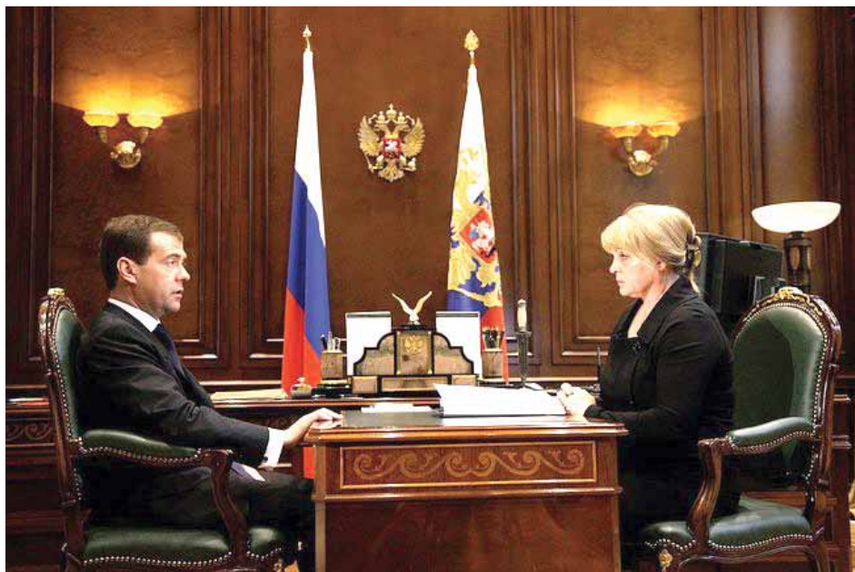
Д.А. Медведев и Э.А. Памфилова. 30 марта 2010 г.