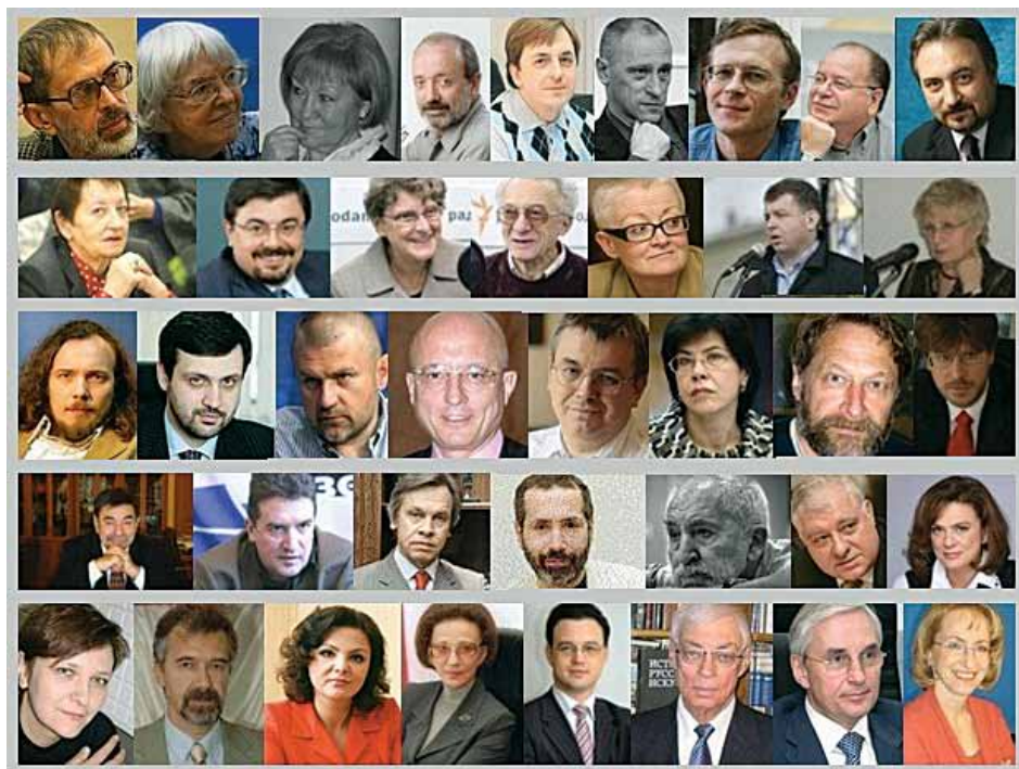
Члены Совета, состав 2011–2012 гг.